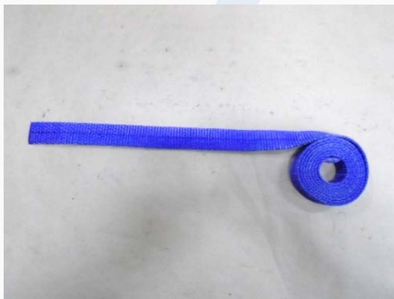
Foto 01 - Antes do ensaio

Procedimento: A amostra foi posicionada na máquina universal de ensaios através de um dispositivo e submetida à força de tração.