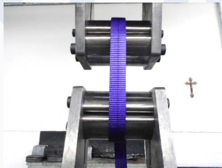
Foto 02 - Durante o ensaio